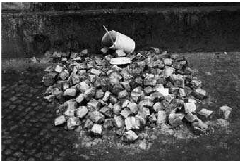
Místo u Národního muzea, kde se Jan Palach polil benzínem a zapálil. Na kostkách leží teplem zdeformovaná nádoba a víčko. Druhá nádoba takřka celá shořela.