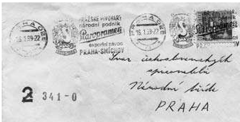
Obálka, ve které zaslal Jan Palach svůj dopis Svazu československých spisovatelů

Skutečnost, že Palach odjel ze Všetat v šest hodin a na Spořilov přišel okolo osmé hodiny, potvrzuje nepřímo také svědectví uklízečky z kolejí, která začala po sedmé hodině vybírat v pokoji popel z kamen a Palacha zde neviděla. 82